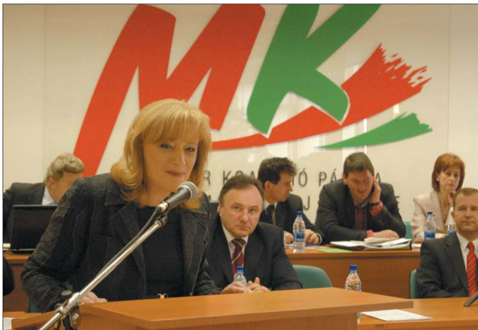
Iveta Radičová, az MKP Országos Tanácsának ülésén

A szlovákiai magyarság létszáma, a benne rejlő anyagi-szellemi potenciál nagy értéket képvisel. A további években ezért ne szenvedjük el tétlen módon a hatalom kénye-kedvét! Az elkövetkező választások mindegyikén ott a helyünk!!! Mindenkinek, mindannyiunknak fel kell vállalnia saját részfeladatát: szavazatával támogatnia a demokratikus eszméket, és az igazi haladást képviselő jelöltet – jelöltek!