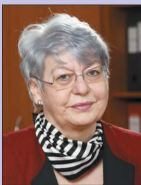
Az EP-képviselő segítheti a petíció eljuttatását az Európai Parlament Petíciós

Bizottságához – az adott esetben ezt a petíciót is inkább ide címezném –, kérdést intézhet a Bizottsághoz, innen valamelyik biztos választát kapja kézhez, felszólalhat a parlament plenáris ülésén. Úgy tűnik, ennek van némi nyomásgyakorló hatása a szlovák hivatalos szervekre. Tavalyi felszólalásom miatt ez ügyben a SMER képviselői hazugsággal vádoltak meg, mivel éppen aznap (!) talál-