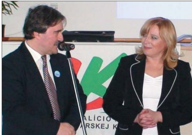
Bárdos Gyula és Iveta Radičová Szencen

„Ő lehet az első olyan köztársasági elnök, akire mi, magyarok is büszkék lehetünk” – mondta Iveta Radičová-ról Bárdos Gyula, az MKP parlamenti frakciójának vezetője Szencen, ahol az ellenzéki államfőjelölt dél-szlovákiai kampánykörútja kezdődött. Amerre ment, szeretettel fogadták azt az embert, aki azok közé a szlovák politikusok közé tartozik, akik őszintén felvállalják a magyarsághoz tartozó lakosság képviselőt. Őszinte, nyitott, határozott emberként végigjárta a magyarok által lakott vidéket. Megfordult Felsőszeliben, Komáromban, az Ipoly völgykatlanban, Nagycsalomján, Füleken, Losoncon, Rimaszombat-