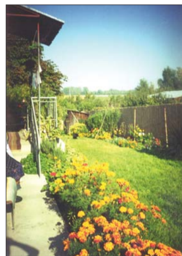
Ez a föld a hazám, itt élt az apám. / Itt tanított nótaszóra édes jó anyám...

– A második világháborút követő időszakban deportálták, kitelepítették a szlovákiai magyarok jelentős részét. Vagyonukat elkobozták. Konfiskálták a szülő-