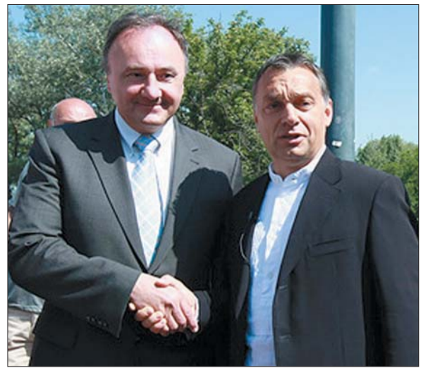
Gratulálunk a Fidesz választási győzelméhez

A MAGYAR KOALÍCIÓ PÁRTJÁNAK KÖZLÖNYE * 2010. ÁPRILIS