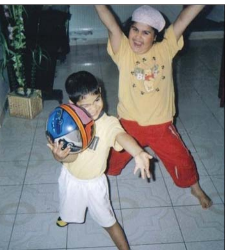
Moncsika és Fricike is bizonyították már tehetségüket